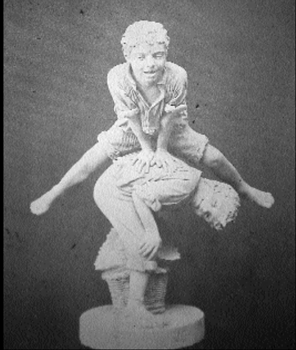
La Il·lustració artística, 16 maig de 1892