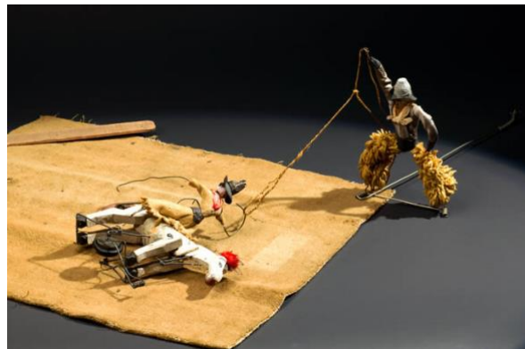
CINEMA ICRE: LA MAGIE CALDER